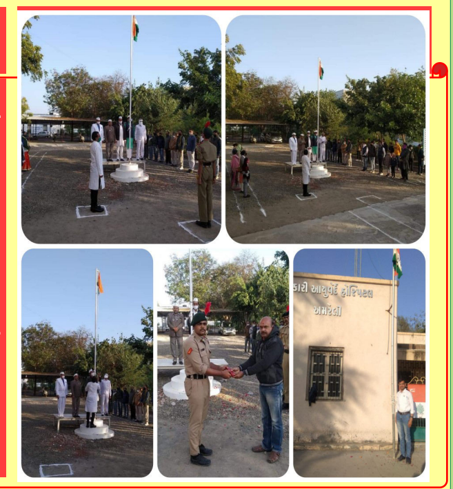
GIR Naad Volume 23 Dtd:- 05/02/2021 Page No.4

On the occasion of 26th January - Republic Day of India, club members done the Flag Hosting Ceremony at Govt. Ayurvedic Hospital - Amreli along with doctors, staff and other Govt. officials. Club also felicitated many Police officers on this day by presenting them Momento.