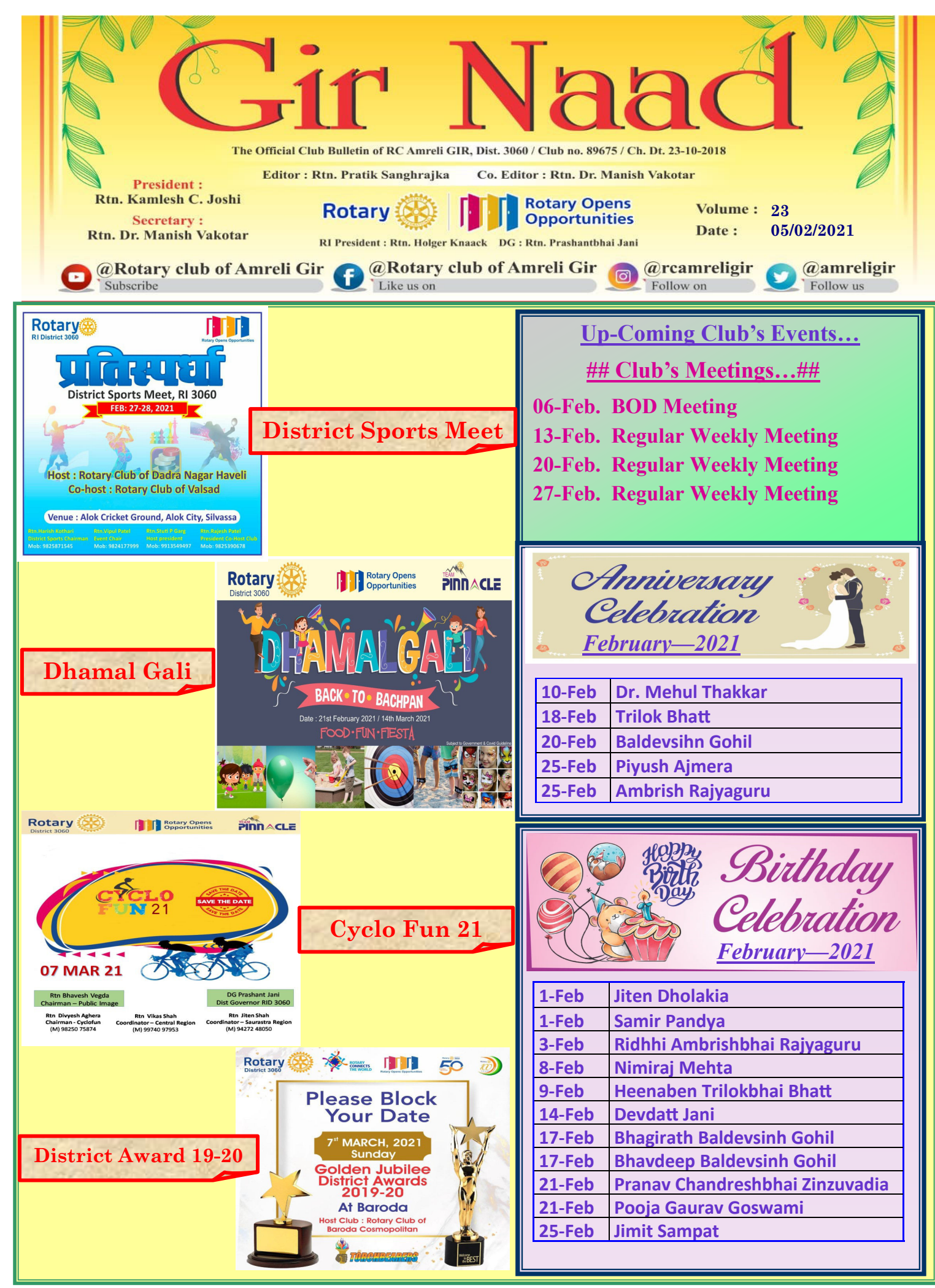
GIR Naad Volume 23 Dtd:- 05/02/2021 Page No.7